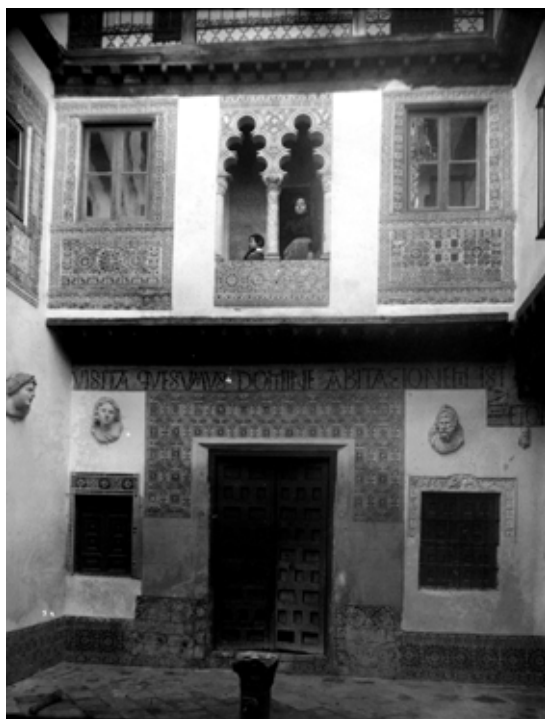
Fig. Callejón del Vicario, n° 4 (casa demolida a fines del siglo XX): A fines del siglo XIX, la casa fue restaurada en estilo neomudéjar [fig. 418] (A.R.)

La planta baja del segundo cuerpo de la casa (A-8b) [fig. 420] comprendía un portal de 5,67 m por 1,82 m, un palacio de 5,67 m por 2,63 m, y una cámara de 5,67 m por 3,24 m imbricada en la casa de al lado. El palacio reposaba encima de un establo que daba a la calle. Un nivel de cámaras, de suelos y de corredores se superponía a la planta baja.