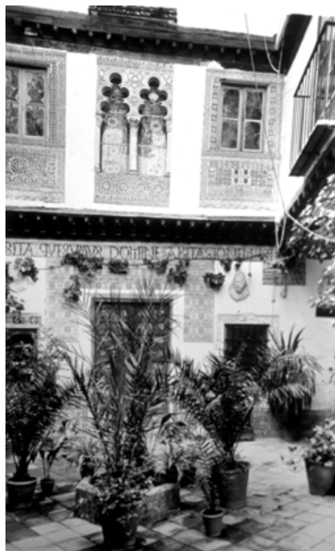
Fig. Callejón del Vicario, n° 4 (casa demolida a fines del siglo XX): A fines del siglo XIX, la casa fue restaurada en estilo neomudéjar [fig. 418] (A.R.)