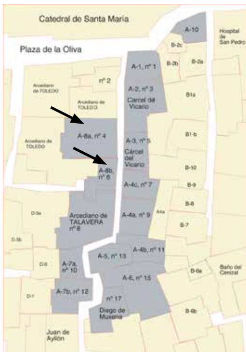
Fig. 405. Callejón del Vicario: numeración adoptada en el texto de 1491 y numeración actual.