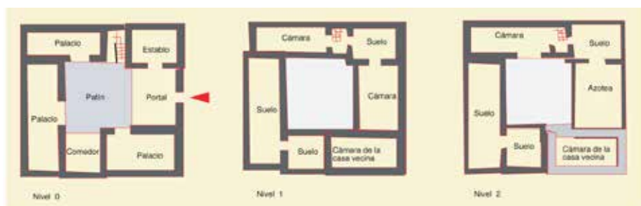
Fig. Callejón del Vicario, nº 4 (casa demolida en la segunda mitad del siglo XX): restitución y planimetría del primer cuerpo de la casa A-8a en el año 1492.