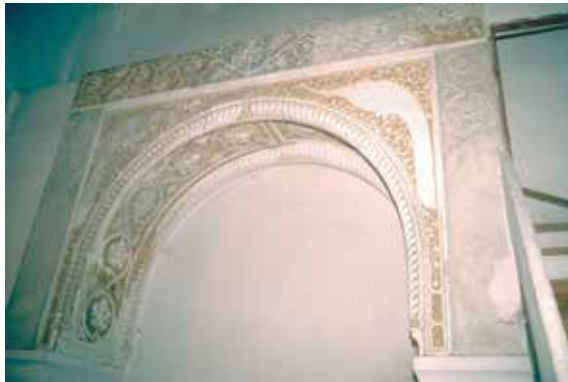
Fig. 338. Plaza de Santa Isabel, nº 5: Palacio del rey don Pedro.

A. Una de las ménsulas del techo del salón principal.