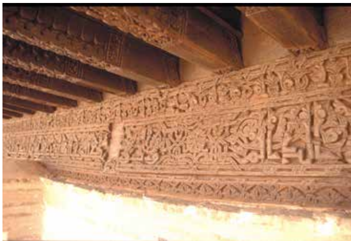
Fig. 339. Plaza de Santa Isabel, nº 5: Palacio del rey don Pedro.

C. Puerta de la quadra principal, depositada en el convento de la Concepción.