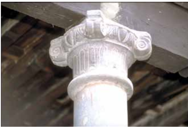
Fig. Callejón del Vicario, nº 8: A. Techo pintado de una de las quadras de la casa. B. Ábside en forma de bóveda de cascarón en el sótano. C. Capitel en el patio.