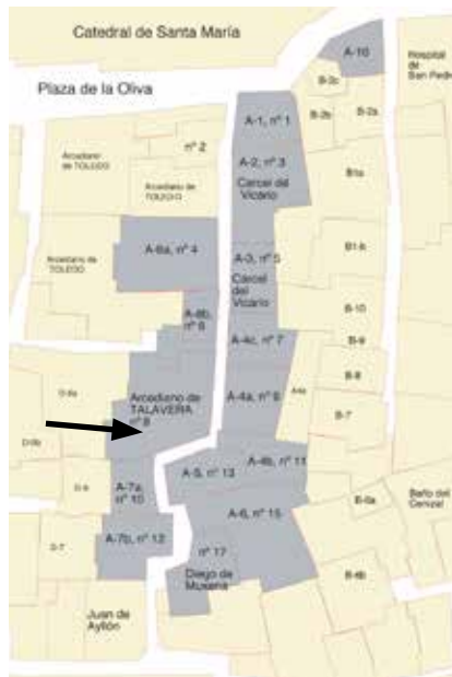
Fig. Callejón del Vicario: numeración adoptada en el texto de 1491 y numeración actual.