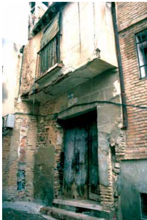
Calle del Ave María, nº 8: