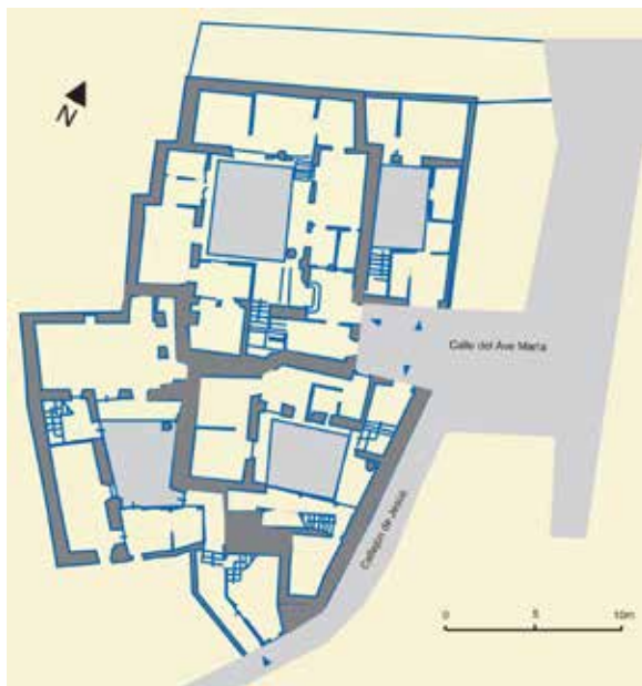
Calle del Ave María, nos 6, 8, 10; Callejón de Jesús, nº 2: plano actual