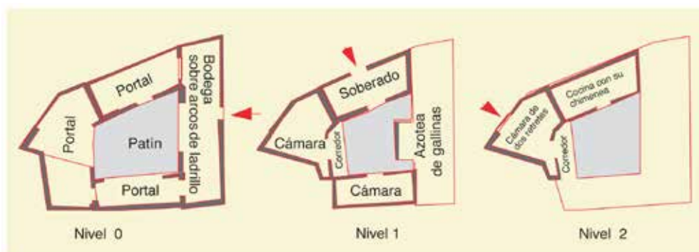
Fig. 240. Calle del Cardenal Cisneros, n° 16: restitución y planimetría de la casa A-10.