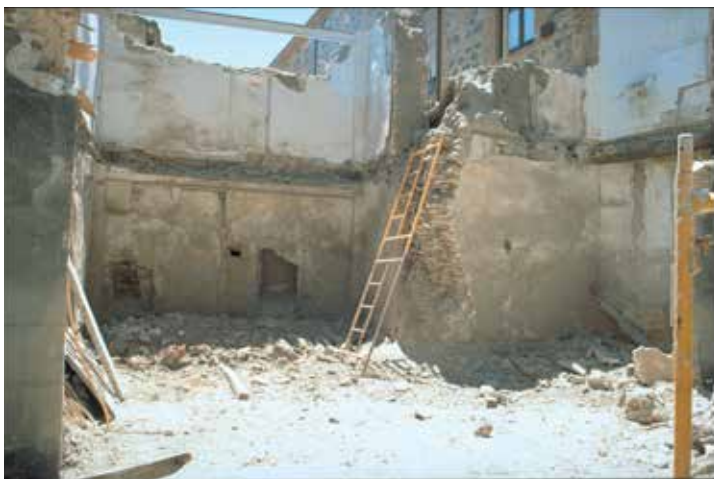
Fig. 237. Fig. 238. Calle Cardenal Cisneros, nº 2: a la derecha, restos del muro maestro de la antigua casa del Deán (Palacio de Justicia), 1997.

En conclusión, las tiendas de la plaza de la Oliva se desarrollaron en sentido vertical de manera que duplicaron el espacio disponible. No obstante, las casas resultantes mantuvieron una tienda en la planta baja. Esta evolución, que tuvo lugar en el transcurso del siglo XV, evidencia el carácter comercial de este barrio situado junto a la catedral.