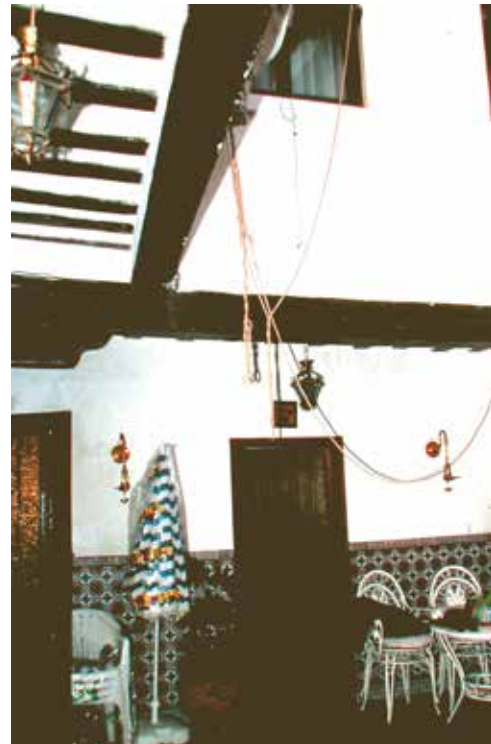
Calle del Barco nº 14: Patio