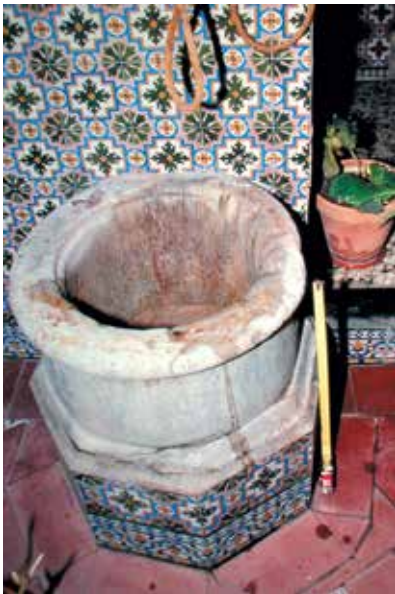
Calle del Barco nº 14: Brocal.