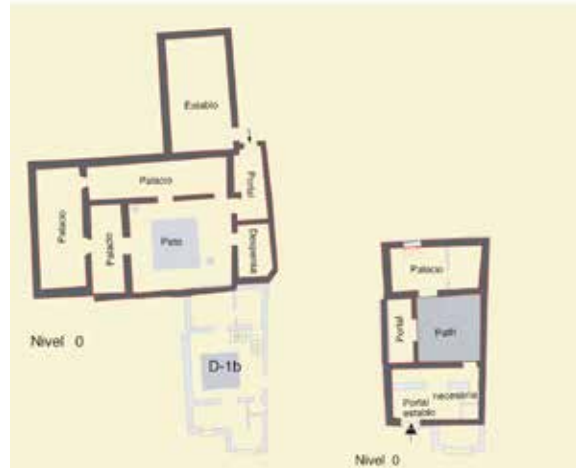
Bajada del Pozo Amargo, nº 2: restitución y planimetría de la casa D-1a y D-1b