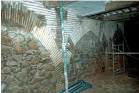
Bajada del Pozo Amargo, nº 2: El muro norte del palacio norte, compuesto por arcos de descarga.

La ausencia de cocina y comedor, la persistencia de unas piezas como los suelos y la carencia de empedrado en los patios, a no ser que se trate de una omisión de los “sennores vesitadores de las posiciones de la santa iglesia de Toledo”, nos hacen pensar que las modificaciones citadas son de antes de mediados del siglo XV. Estimamos que se realizaron al final del siglo XIV. Desafortunadamente, faltan textos que permitan fortalecer esta opinión.