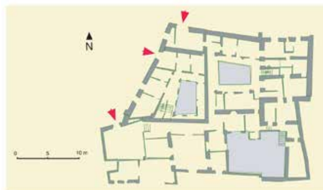
Bajada del Pozo Amargo, nos 5 y 7: plano actual.

Bajada del Pozo Amargo: numeración adoptada en el texto de 1491 y numeración actual.