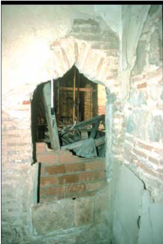
Bajada del Pozo Amargo, n° 5: Arco conopial: aparejo de piedra e hilada de ladrillo de la quadra (desaparecida).

El segundo cuerpo, más pequeño, comprendía en la planta baja un corredor de más de 6 m de largo, un patio pequeño, un establo y dos apartamentos. El primer nivel tenía dos apartamentos y una cocina.