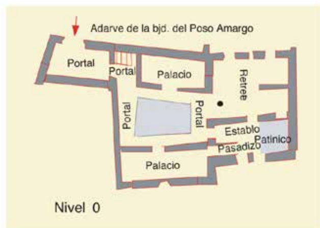
Bajada del Pozo Amargo, nº 5: restitución y planimetría de la casa D-5a en el año 1492.