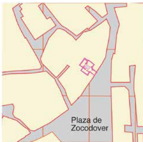
Calle de las Armas, nº 3: situación del mesón AA-2.