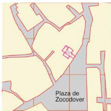
Calle de las Armas, n° 1: situación del mesón AA-3.

www.medievalgis.eu contact@medievalgis.eu