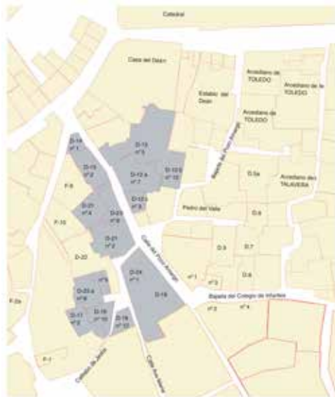
Calle del Pozo Amargo: numeración adoptada en el texto de 1491 y numeración actual.