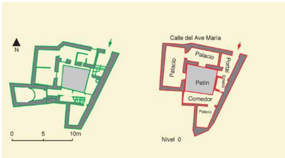
Calle del Ave María, n° 10: plano actual; restitución y planimetría de la casa D-16