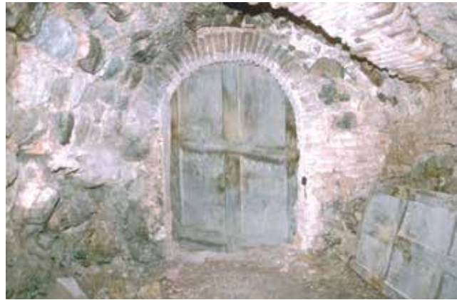
A. Calle del Ave María, nº 10: Patio. La ventanilla de la cámara baja es visible en el muro norte.