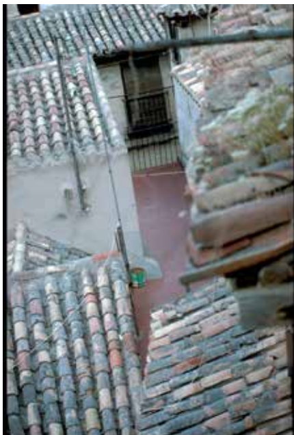
Fig. 3554. Calle del Pozo Amargo, nº 4: D-21: "calle corral con su latrina"

Por lo que se refiere al origen de la casa D-20, nos sentimos tentados a ver la reorganización de un espacio antiguo hacia el final del siglo XIV.