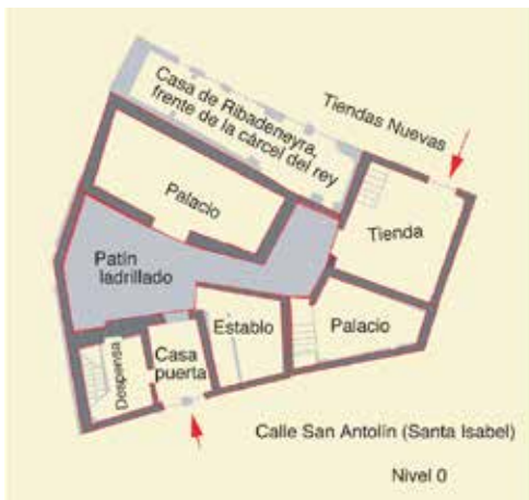
Calle de Santa Isabel, nos 6 y 4: restitución y planimetría de la casa F-8

La casa F-8 tenía además una tienda de 4,45 m de lado que daba a las Tiendas Nuevas. También se le habían añadido una cámara que cargaba sobre casa y un establo de 2,43 m de lado situado bajo la casa principal.