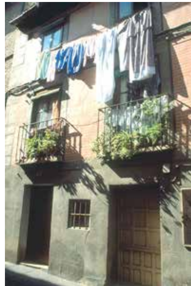
A. Plaza del Ayuntamiento, nº 6: Escalera hacia el sótano y columna reutilizada. B. Calle de Santa Isabel, nº 6: fachada de uno de los componentes de la casa F-8 (casa puerta y dispensa).