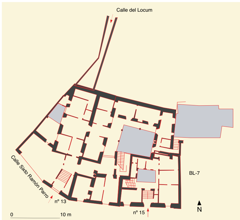
Calle Sixto Ramón Parro, nºs 13 y 15: plano actual