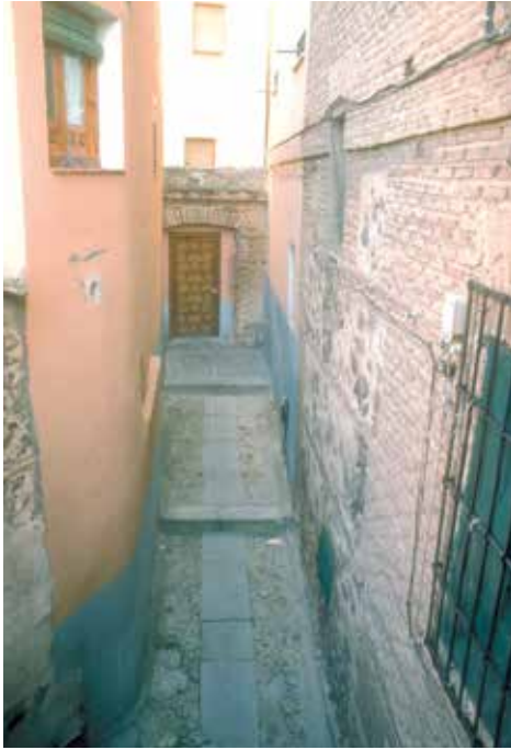
Calle Sixto Ramón Parro, n° 13: Resto de un adarve privatizado al norte.