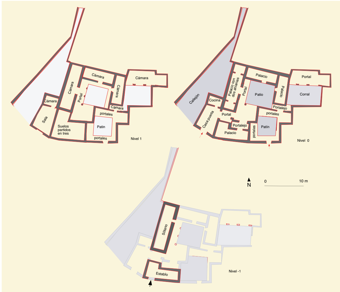
Calle Sixto Ramón Parro, n° 13: restitución y planimetría de la casa BL-6 en el año 1492.