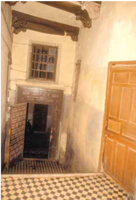
Calle Sixto Ramón Parro, n° 13: Puerta principal de la casa en la entrada de una antigua calle privatizada.