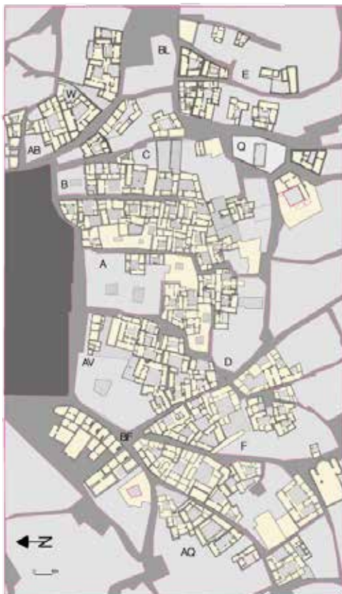
Barrio sur de la catedral: casas identificadas y restituidas según el texto de 1492