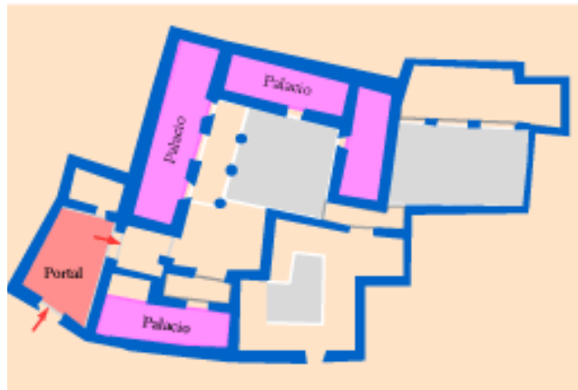
Tipo 4. Cuatro palacios alrededor del primer patio, cuatro portales alrededor del segundo patio, un solo portal grande en el corral.