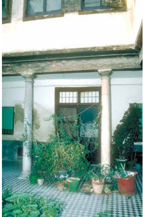
Calle Sixto Ramón Parro, n° 13: Patio, puerta del palacio principal, columnas blanca y gris de la galería.