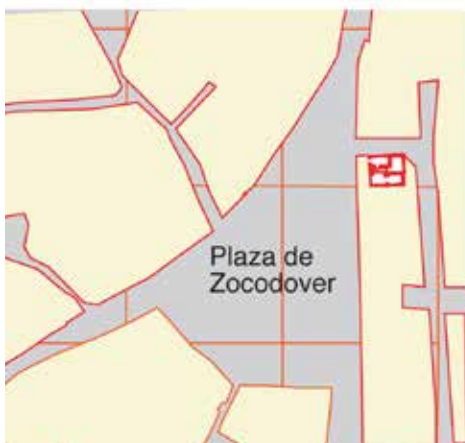
Plaza de Zocodover: situación del Mesón de San Cristóbal.