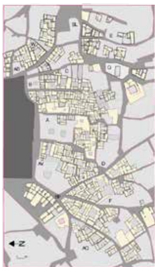
Barrio sur de la catedral: casas identificadas y restituidas según el texto de 1492