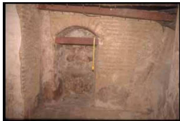
Fig. 253. Calle Sixto Ramón Parro, n° 1 y Calle del Locum s/n: una de las ocho pesebreras de la caballeriza del siglo XVI, observables en el sótano actual.