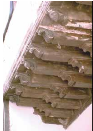
Calle de San Marcos, n° 8: Portal, saledizo de dos niveles de canes, cabeza de madera tallada.