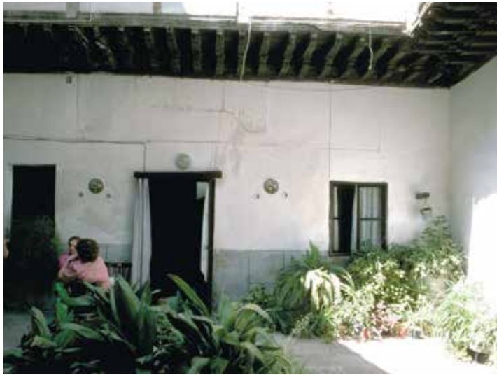
Calle de San Marcos, n° 8: Patio y puerta del palacio principal (el dintel bajo el saledizo del portal indica que la puerta del palacio era antes más amplia).

A fines del siglo XV la casa tenía dos niveles sobre la planta baja. Se describen un establo a la izquierda de la entrada y una azotea descubierta. Fue remodelada en los siglos XVI y XVII.