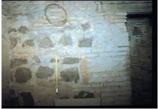
Calle de San Marcos, n° 17: A. Patio, estado actual.