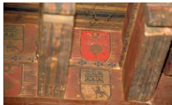
Calle de la Ciudad, n° 9: A. Canes pintados en el portal (siglo XV), B. Detalle