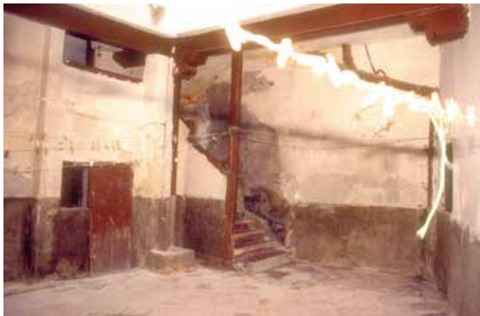
Bajada de San Justo, n° 4: Patio hacia el comedor.

Tiene mas esta dicha casa otro cuerpo de casa que sale la puerta al çimenterio de Santi Yuste que ay en ellas un patin e en este patin estan dos pieças una a la mano derecha e otra a la mano ysquierda. En la de a manderecha ay seys (?) varas e media en largo e quatro e media en ancho [en la] de a manisquierda ay tres varas en largo e otras tres [en ancho] con dos soberados uno sobre otro de su tamanno [destas] pieças. Testigos los suso dichos. (firmado) Juan de Mayorga notario apostolico. /fº 233 rº=º 231 rº mod./