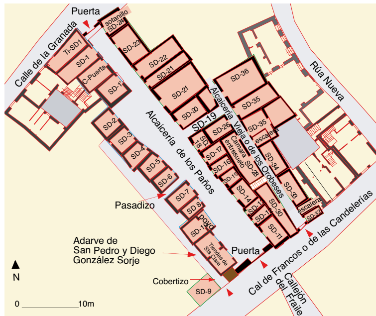
Calle de la Sinagoga: Restitución y planimetría de la planta baja de las Alcaicerías de los Paños y de los Orobases en los años 1460. .