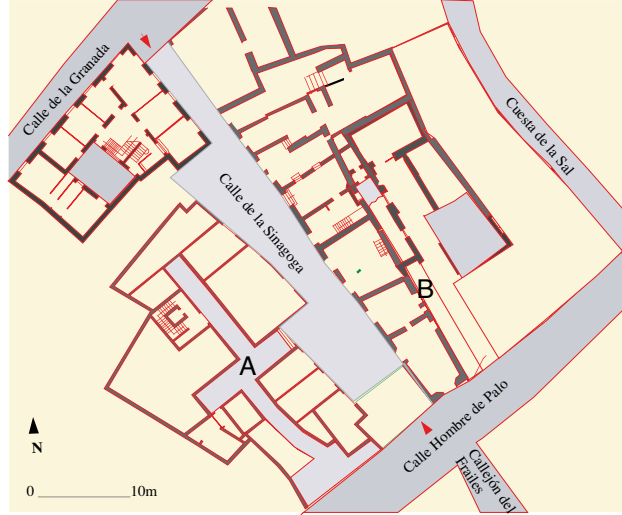
La calle de la Sinagoga: estado actual. Se nota, a cada lado de la calle, el trazado de dos adarves modificados (A y B). A la izquierda, subiendo hacia la calle de la Granada, un edificio nuevo ocupa el trazado de un adarve medieval (A); a la derecha se ha conservado el trazado parcial del adarve medieval (B) (Alcaicería de los Orobases)