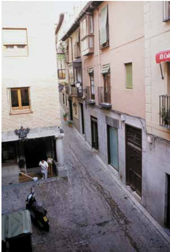
Calle de la Sinagoga, calle principal de la Alcaicería de los Paños