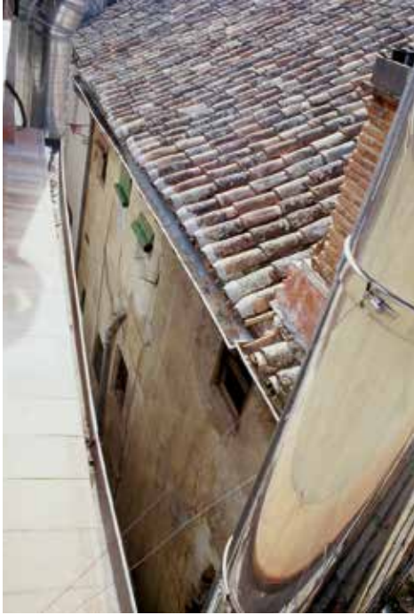
Calle de los Orobases: aunque privatizada desde hace más de un siglo conserva visibles los tejados de sus antiguas casas