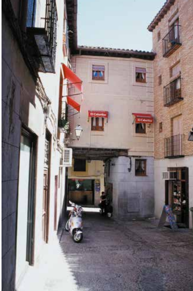
Calle de la Sinagoga, cobertizo donde estaba la puerta principal de la Alcaicería de los Paños

XIV y de 1467 que afectaron profundamente este conjunto, sobre los cuales hablaremos en otro capítulo, contribuyeron a la transformación de las tiendas heredadas de la época musulmana.