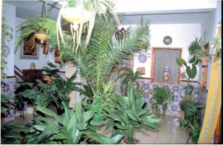
Callejón de San Pedro, nº 12: patio

El palacio norte tenía una alcoba que en 1492 “esta metida... en el otro palacio frontero”; esto parece significar que en la segunda mitad del siglo XV se efectuó una reorganización del espacio habitado. En favor de esta posibilidad volvemos a encontrar un aumento del precio del arrendamiento, que se duplicó desde 1459 a 1480, pasando de 880 maravedís y un par de gallinas a 1.550 maravedís y tres pares de gallinas.