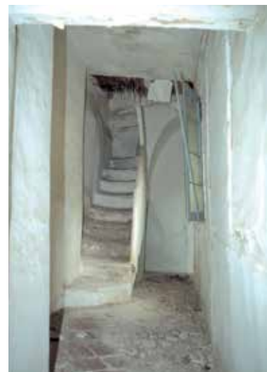
Callejón de los Bécquer, nº 11 (casa BM-1): Escalera.