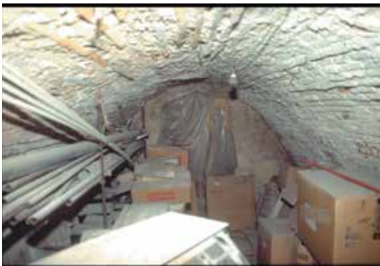
Calle de la Sal, nº 13: A. Cuarto citado en el siglo XV encima de la sala del aljibe. B. Sótano abovedado en el cual estaba el establo.