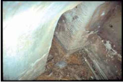
Calle de la Sal, nº 13: Sótano profundo transformado en aljibe y una abertura en un muro ancho, hacia otro cuarto.