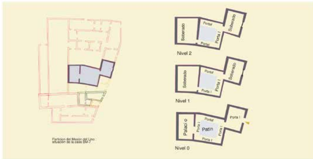
Calle de Santa Justa, nº 3: restitución y planimetría de la casa BM-7.

portales de su tamaño, unos sobre otros, e frontero un palacio en que ay siete varas en largo e tres e media en ancho, e un portal a la puerta en que ay tres varas en largo e una en ancho, con dos soberados ensomo de al tanto del portal e del palacio. De que testigos Diego de Obregon e Françisco de Sant Roman criados de los dichos sennores. (firmado) Juan de Mayorga notario apostolico.