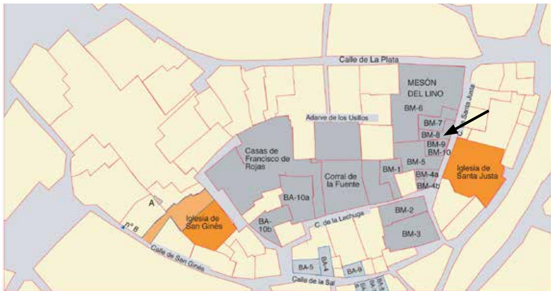
El barrio de San Ginés y de Santa Justa: las casas mencionadas en el siglo XV.