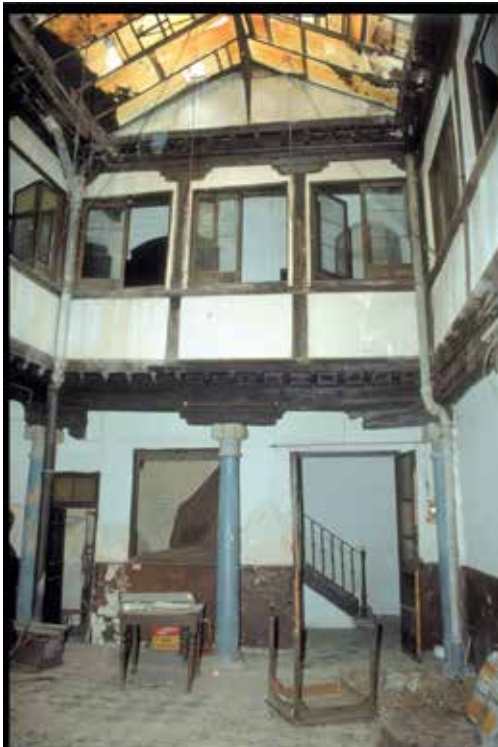
Calle de los Bécquer, n° 7 : Patio de la casa.

La parcela sobre la cual está edificada la actual casa del n° 7 ha sido ocupada sucesivamente por una casa corral en la edad media y una casa principal llamada “ casa de la fuente ” en el siglo XVI. Este nombre parece indicar la existencia de una fuente natural en esta parcela. Las excavaciones arqueológicas podrían verificar esta hipótesis y sacar a la luz elementos comunes a las dos casas vecinas ocupadas por los hermanos Acre en el siglo XV.