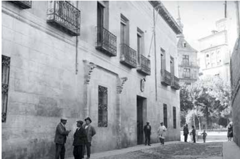
Calle del Cardenal Cisneros, s/n: la casa del Deán. Una ventana ocupa parte del espacio de la puerta principal, de la cual se conservaban todavía, al final del siglo XIX, jambas y modillones (AR).