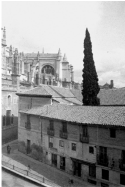
Calle del Cardenal Cisneros, s/n: la casa del Deán. A. Vista de los tejados y de la fachada oeste, junto a la cual estaban las tiendas del Deán (AR).