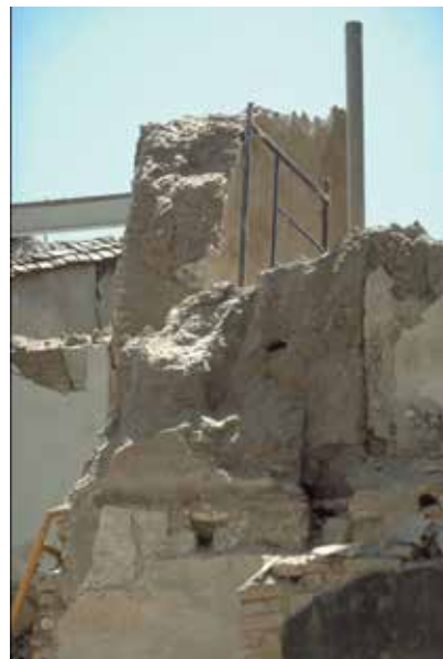
B. Muro este de uno de los grandes salones; lindaba con la casa nº2 de la calle Cardenal Cisneros y fue demolido con ella. Este muro estaba hecho en tapial, Foto J.P., 1997.