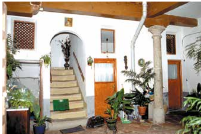
Bajada de San Justo, n° 2: Patio.