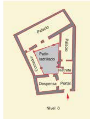
B. Calle de Santa Isabel, nº 20: restitución y planimetría de la casa F-3a.