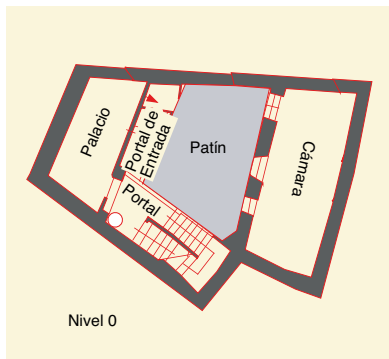
Calle de Santa Marcos, n° 9: restitución y planimetría de la casa AQ-10 (antigua casa F-4c).

lado de la calle. El nivel superior contaba con tres cámaras y una azotea cubierta. Un bloque compuesto por una cámara y una azotea encima de ella se superponía a uno de los palacios de la casa F-4a.