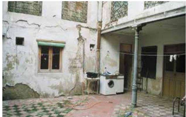
Fig. 314. Calle de Santa Isabel, nº 18: A. Portal de entrada F-4b. Calle de San Marcos, nº 7: C. Patio y portal hacia la entrada F-4a. Calle de San Marcos, nº 9: B. Portal de entrada de la casa AQ-10.