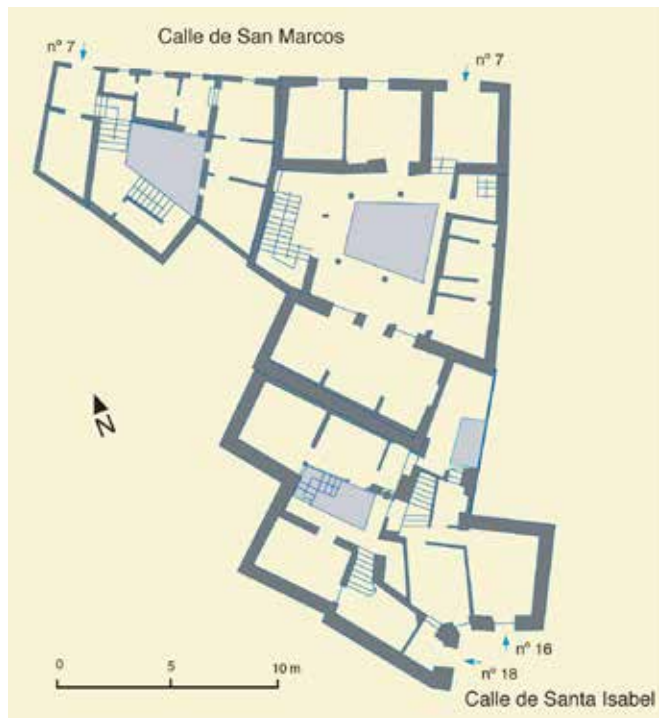
Calle de Santa Isabel, n°s 16 y 18; Calle de San Marcos, n°s 7 y 9: plano actual

Calle de Santa Isabel, n° 16 y 18 Calle de San Marcos, n° 7 y 9