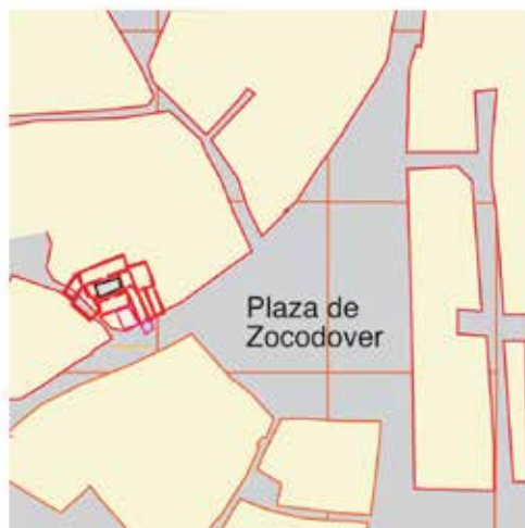
Calle Nueva, nº 2: situación del Mesón de los Paños

Calle Nueva, nº 2, Comercio calle del (Ancha) nº 46 (96) J.P. 2018