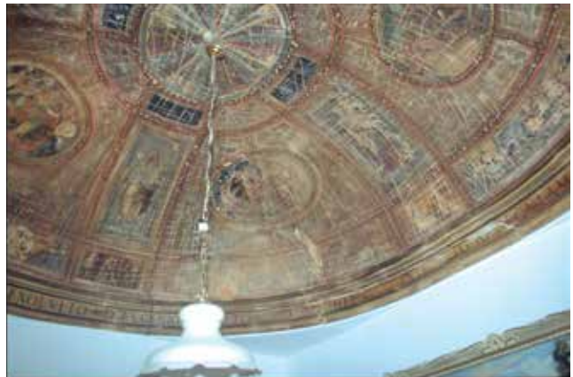
Callejón de San Pedro, nº 11: A. Patio y un nicho de aljibe al fondo. B. Sótano con bóveda de medio punto. C. Capilla privada con cúpula del siglo XVI, en el ángulo del nivel 1 encima del retrete.