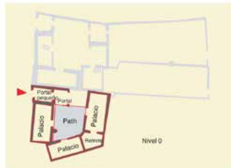
Callejón de San Pedro, nº 11: restitución y planimetría de la casa B-5 en 1492