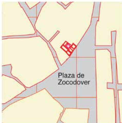
Plaza de Zocodover, n°5: situación del Mesón de la Madera AA-8