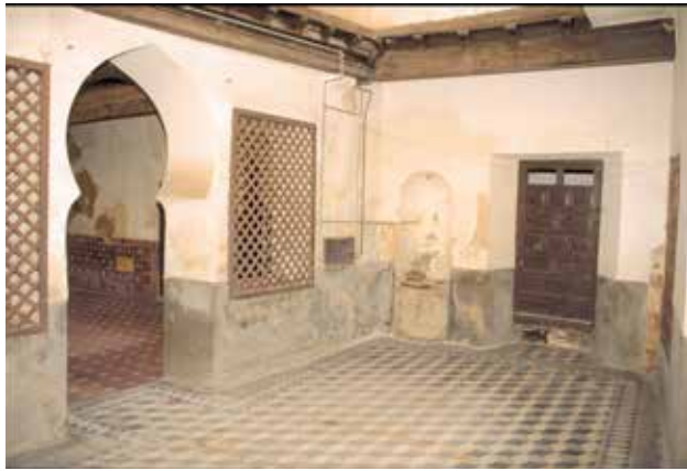
Calle de Santa Úrsula, nº 11: Segundo patio.

Esta casa fue restaurada, a principios del siglo XX, en estilo neomudéjar.