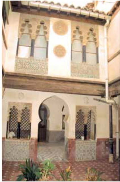
Calle de Santa Úrsula, n° 11: El portal y la galería a fines del siglo XX.