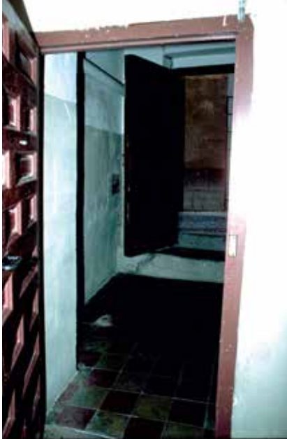
Callejón de San Pedro, nº 1: Vista del portal de entrada desde el patio.

La descripción de la casa en 1492 indica que la cámara que el cabildo había exigido a su ocupante en 1443 se llegó a construir. Parece claro que se puede relacionar la ampliación de la superficie habitable con el incremento del precio, que pasó de 351 a 600 maravedís. Es probable que se empedrara el patio en esa misma época.