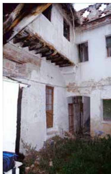
Fig. - Calle del Cristo de la Parra, nº6 (casa BC-4): Puerta principal del palacio interior, patio