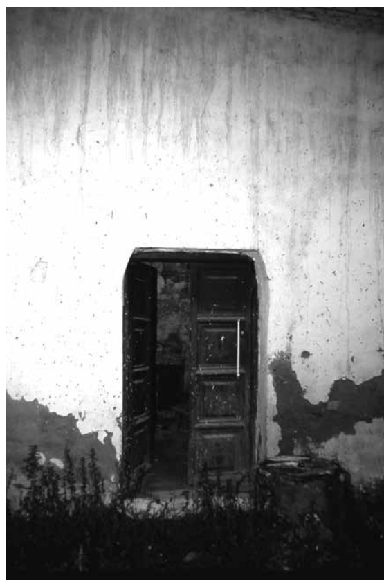
Fig. - Calle del Cristo de la Parra, nº6 (casa BC-4): patio y puerta del palacio frontero.