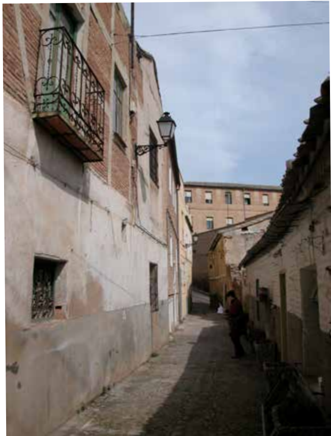
Fig. 1 Callejón del Cristo de la Parra, casa BC-7 a la izquierda.