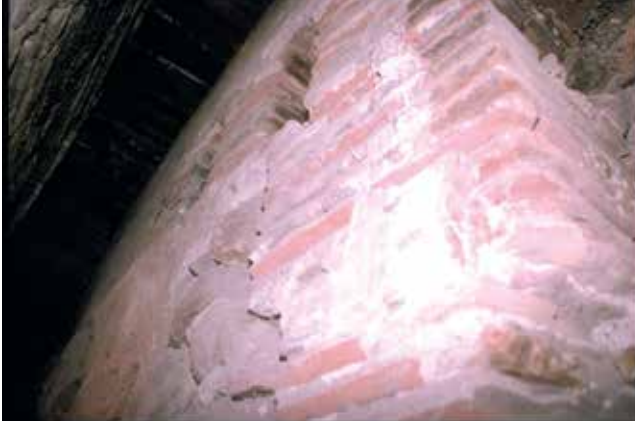
Calle del Ave María, nº 8: Muro exterior del pequeño palacio.

cocina edificada sobre la entrada de la casa D-16. El segundo nivel se reducía a una cámara al oeste del patio.