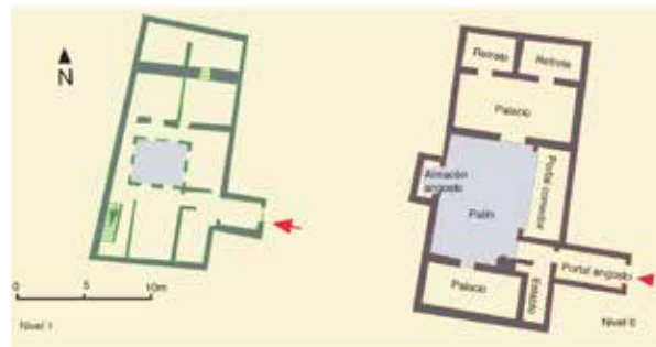
Bajada del Pozo Amargo, nº 8: restitución y planimetría de la casa D-3.

Bajada del Pozo Amargo: numeración adoptada en el texto de 1491 y numeración actual.