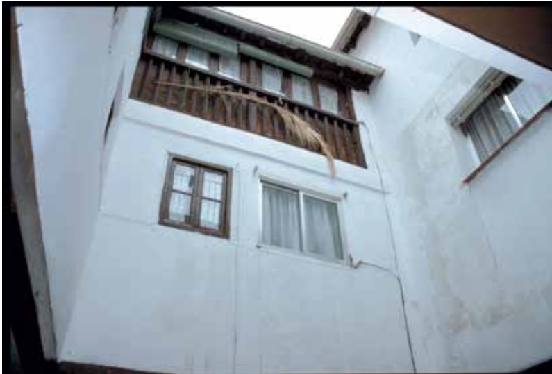
Bajada del Pozo Amargo, n° 8: primer y segundo nivel, que abren al sur en el patio

Desde el final del siglo XV, en esta casa se fueron realizando numerosas modificaciones interiores cuya cronología no se puede establecer con precisión. Se edificaron corredores en todos los lados del patio, mientras que en el siglo XV solo los tenía el lado este. Los niveles altos fueron convertidos en pequeños apartamentos. Esta remodelación tuvo como consecuencia en la planta baja la transformación del espacio del comedor en cocina y necesarias y la construcción de una cámara en el lugar del establo. Por el contrario, la cocina del piso primero se mantuvo en su sitio. La azotea, que ocupaba un solo lado de la casa, fue reemplazada por un apartamento que se extiende sobre la totalidad del segundo piso. El palacio norte ha conservado sus muros principales, que tienen un grosor de más de 80 cm.