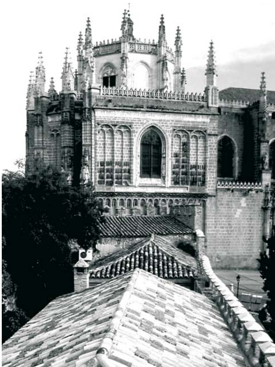
Figura 4.- El ábside de la iglesia de San Juan de los Reyes visto desde la Alacava.

el convento a fines del siglo XV y la Judería, citaremos algunas de las conclusiones del artículo que dedicamos a la sinagoga del Sofer 17 .