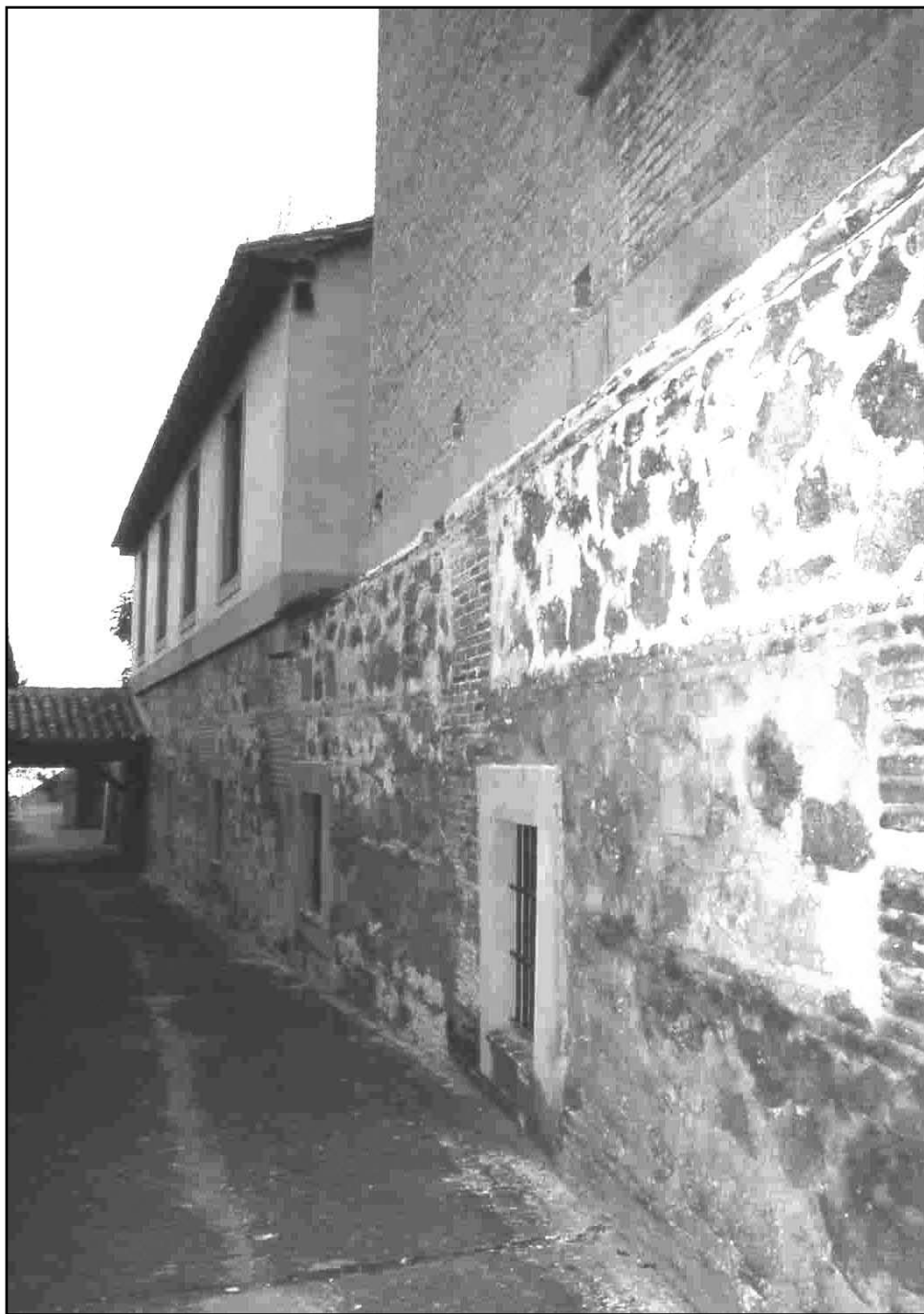
Figura 2.- La calle del Mármol, hoy privatizada, hacia la iglesia de San Juan de los Reyes y el cobertizo. A la derecha, se nota la planta baja de un cuerpo del segundo claustro (hoy desaparecido).