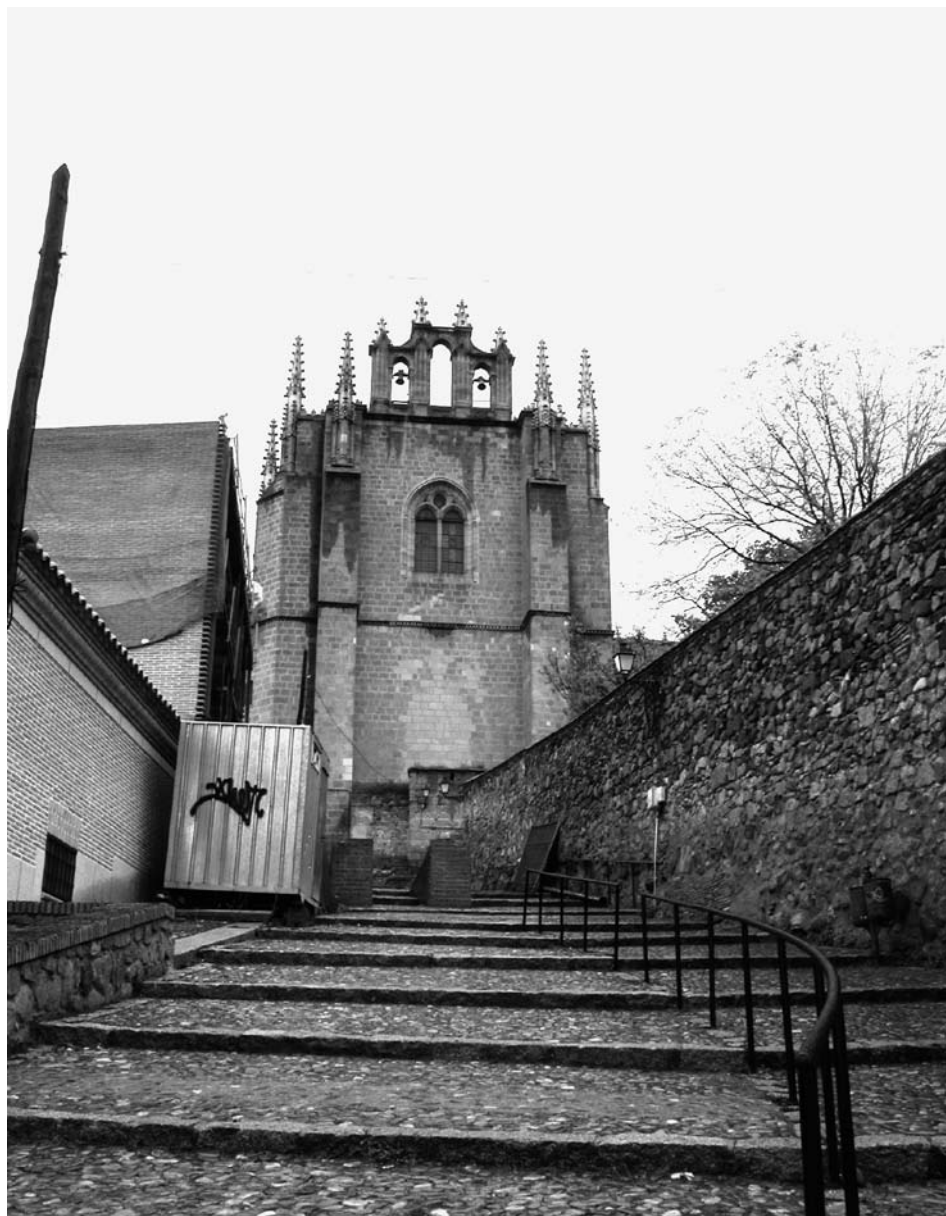
Figura 3.- La fachada oeste de la iglesia de San Juan de los Reyes vista desde la bajada al puente de San Martín.