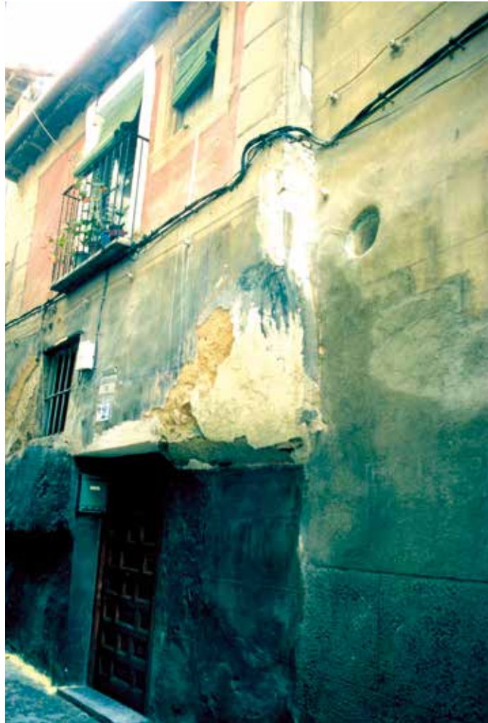
Calle de San Miguel, n° 2: antiguo horno de pan de Santa Clara.

ancho y largo de lo de abajo y encima de esto de todo el ancho y largo esta hecho un terrado y aposento que la mitad de ellos es cubierto y la mitad terrado. El terrado cae hacia la calle que va hacia a sanct Miguel y el aposento hacia las casas de doña ynes de quemada. Todas estas medidas son sin gruesos de paredes no es ynfiçiarario ny superfiçiararia a nadie y es casa bien tratada.