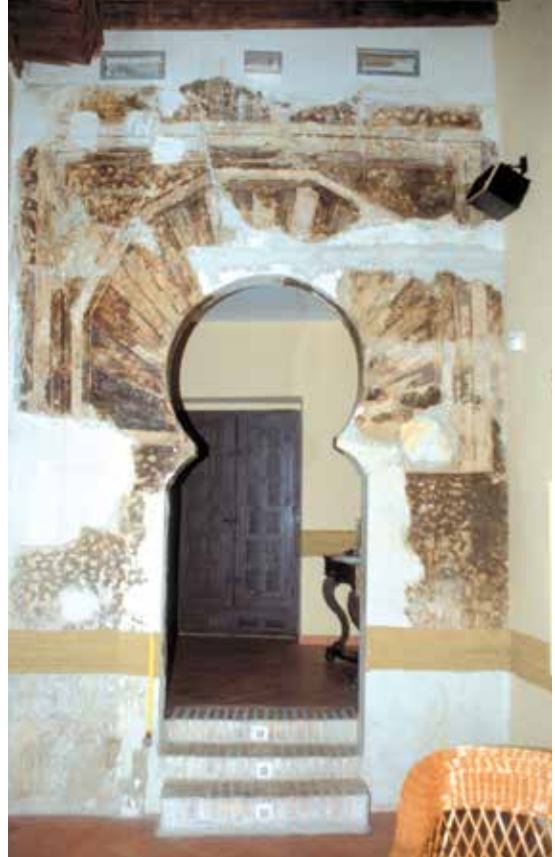
Fig. 606. Calle de la Soledad n° 2: Vista del palacio oeste. Arco de herradura de la alcoba.