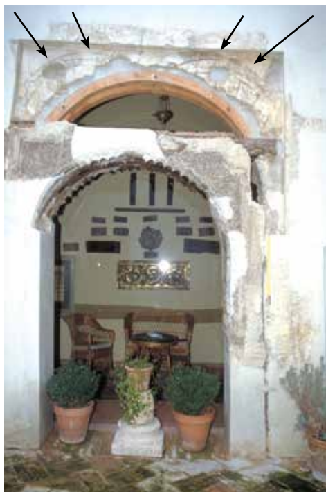
Calle de la Soledad n° 2: Dos arcos islámicos geminados y uno mudéjar de medio punto superpuestos.