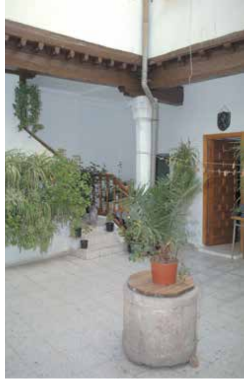
Calle de San Miguel, n° 5: casa AO-12. Patio.