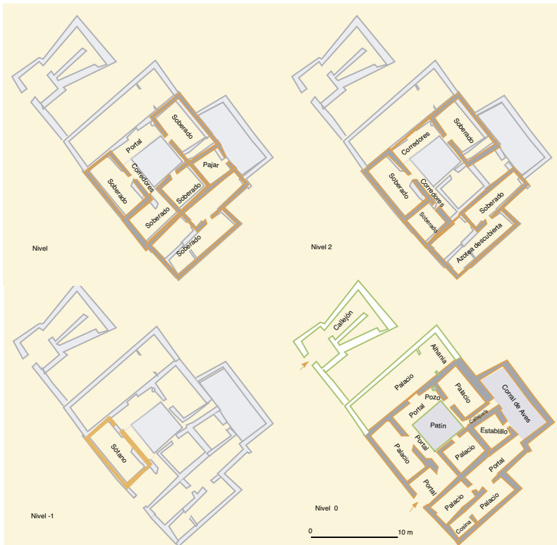
Calle de San Miguel, n° 3, 5: restitución y planimetría de la casa AO-12 en el año 1491.