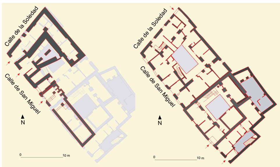
Calle de San Miguel, n° 1 y 3: plano del sótano y de la planta baja antes de la restauración en el año 1999.