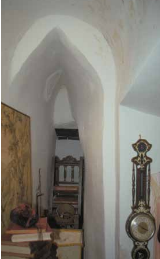
Fig. 604. Calle de San Miguel, n° 1: pieza que ocupa el antiguo "callejon que disen que se troco.."