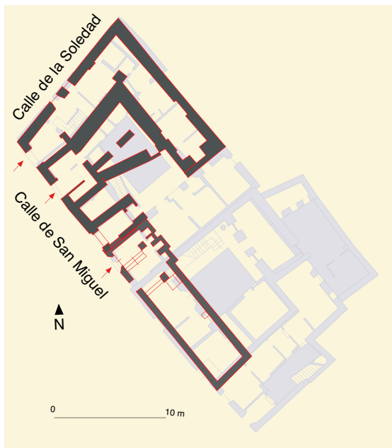
Calle de San Miguel, n° 3: plano actual, restitución y planimetría de la bodega en el año 1599.