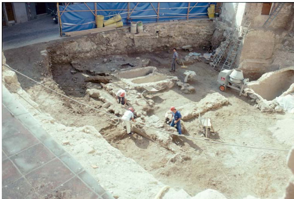
Sitio de las casas CB-52, 53, 54, 55.

Testigos que fueron presentes alonso peynero e marcos crespo. Tiene esta casa ocho pieças de largo quarenta e quatro varas e tres quartas e de ancho treynta e dos varas e una quarta.