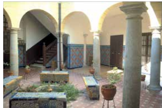
Calle Sixto Ramón Parro, n° 9: el patio con pórtico