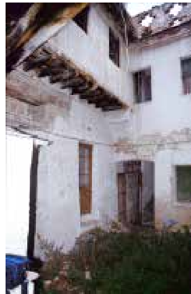
Fig. - Calle del Cristo de la Parra, n°6 (casa BC-4): Puerta principal del palacio interior, patio