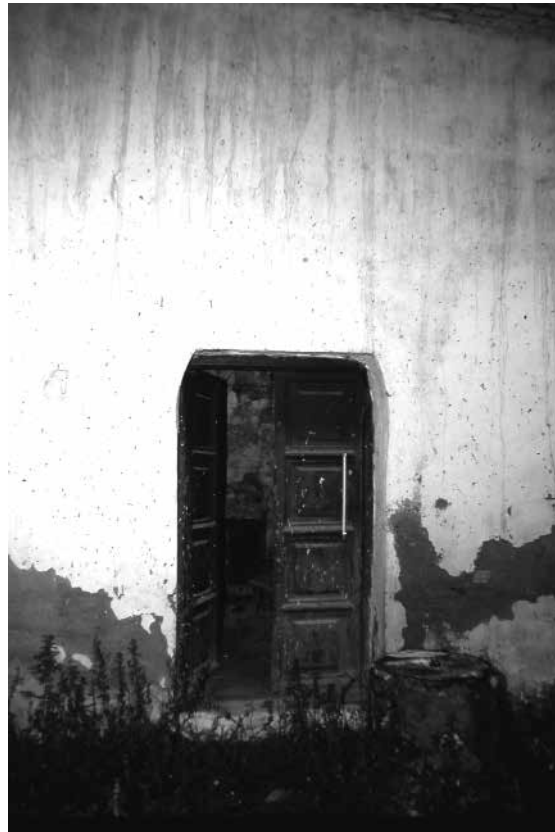
Fig. - Calle del Cristo de la Parra, n°6 (casa BC-4): patio y puerta del palacio frontero.